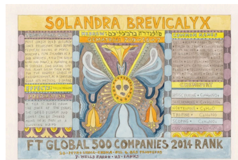
HFT The Gardener, HFT/Outsider artworks/ Solandra brevicalyx (Kieli or Kieri), Suzanne Treister, 2014-15, pinceau et aquarelle sur papier, 21 x 29,7 cm © Suzanne Treister