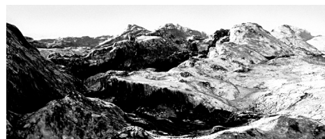
Haptophilia, Nicolas Gourault, 2016