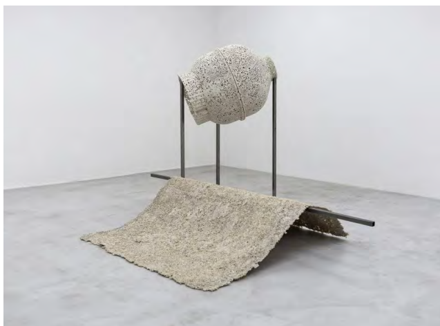
O3 VALENTIN MARTRE, 2020