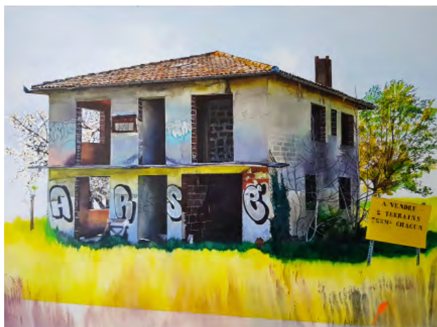
O1 CASSANDRE FOURNET, 2019

– CLIFFHANGERS , Espace d'art contemporain Lieu-commun, Toulouse (31), 2018