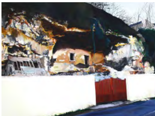
O2 CASSANDRE FOURNET, 2016