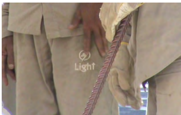
06 THOMAS STEFANELLO, 2021