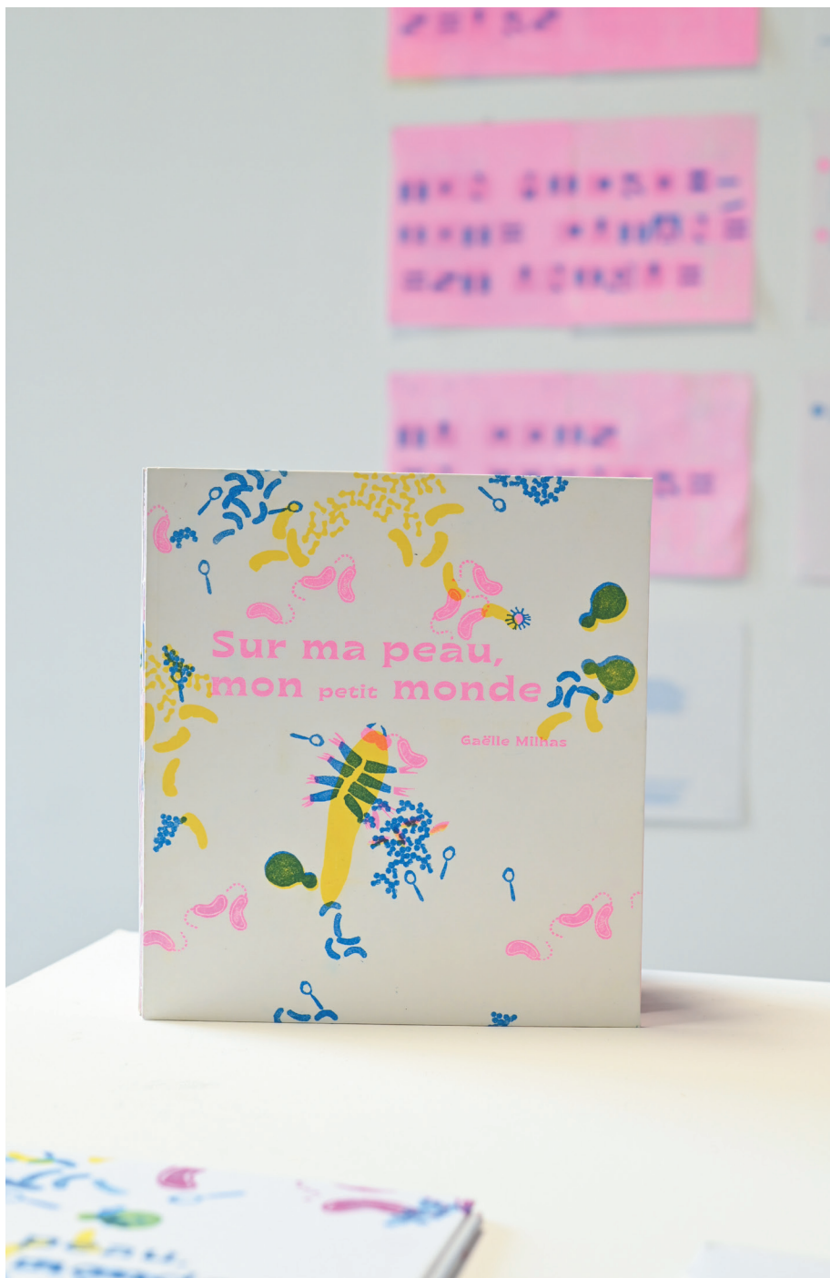
Gaëlle Milhas, DNSEP Design graphique & multimedia, juin 2021, ÉSAD Pyrénées, site de Pau.