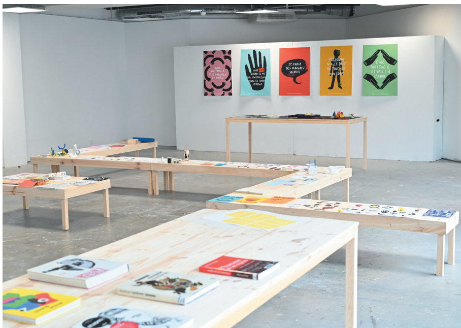
Lucie Roche, DNSEP Design graphique & multimédia, juin 2021, ÉSAD Pyrénées, site de Pau.