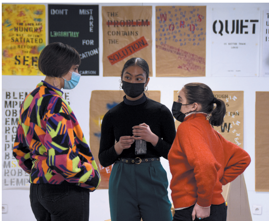
Deux étudiantes de l'ÉSad Pyrénées présentant leurs travaux à une visiteuse lors de la journée portes ouvertes, janvier 2022. Crédit Photo : Audrey Laborde, étudiante en 5 e année de design graphique multimédia.