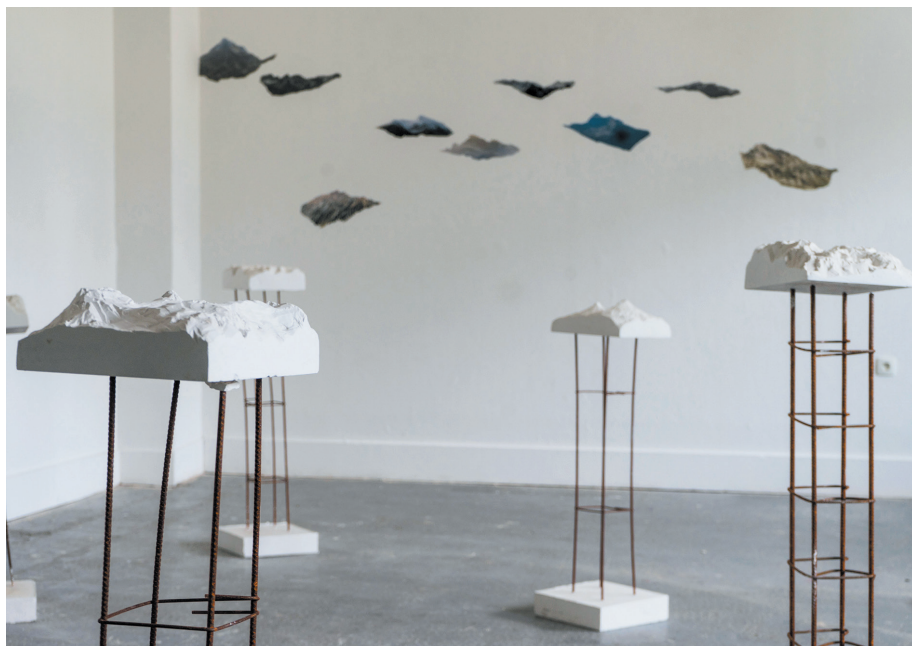
Alice Bodin, DNSEP Art, 2020, ÉSAD Pyrénées, site de Tarbes.