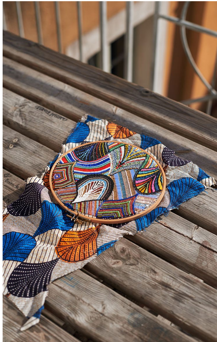
Louise Camilli, Wax Remix , broderie de perles sur tissu wax, 20 cm de diamètre, 2017.