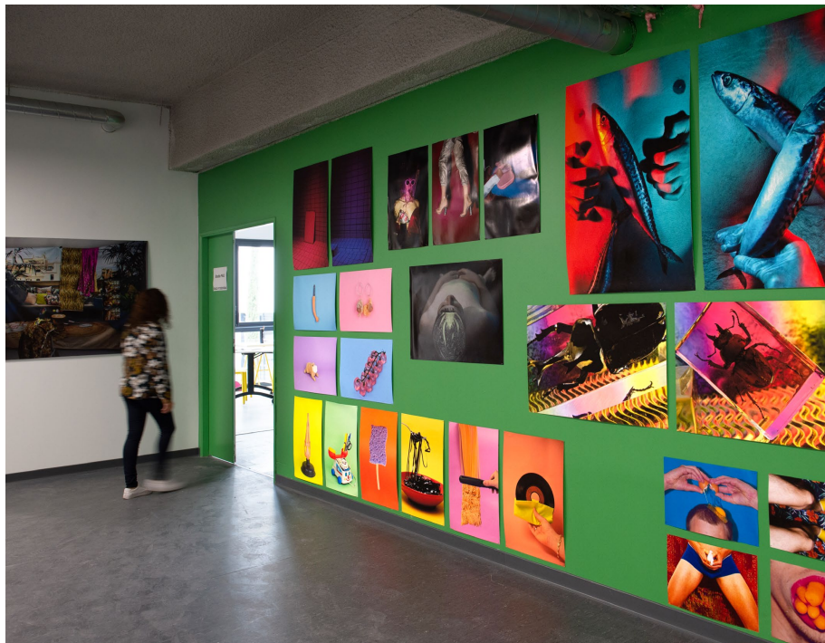
Nom Prénom, Titre , format, technique, année