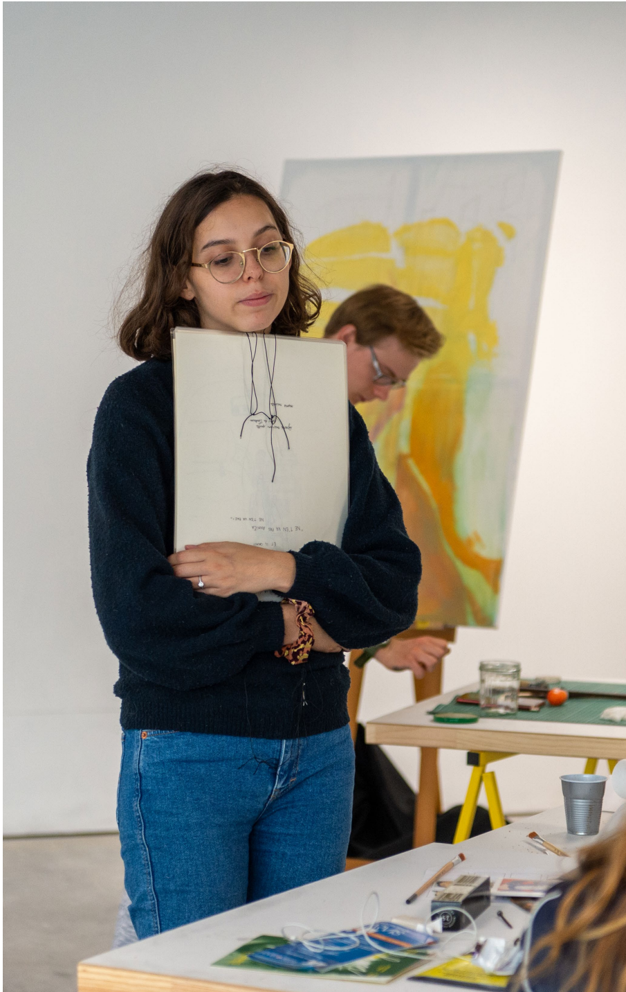
Nom Prénom, Titre, format, technique, année