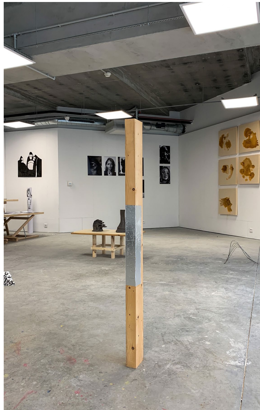
Nom Prénom, Titre , format, technique, année