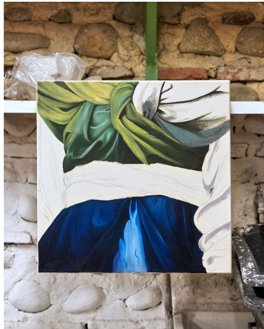
Louise Camilli, Drapé en construction , huile sur toile, 50 x 50 cm, 2017.